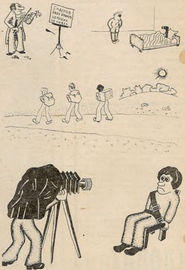
Малюнкi Ю. НОВІКАВА і А. ДАНЕКІНА.

ДЗЯРЖАўНАЯ 3-працэнтная ўнутраная пазыка выпуску 1966 года карыстаецца вялікай папулярнасцю сярод насельніцтва.